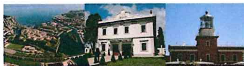
VALORE PAESE DIMORE